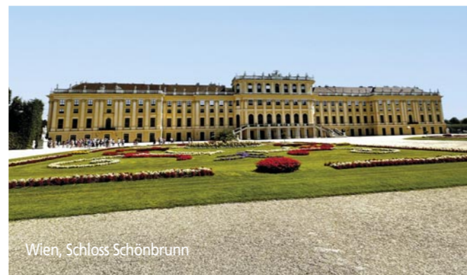
Wien, Schloss Schönbrunn