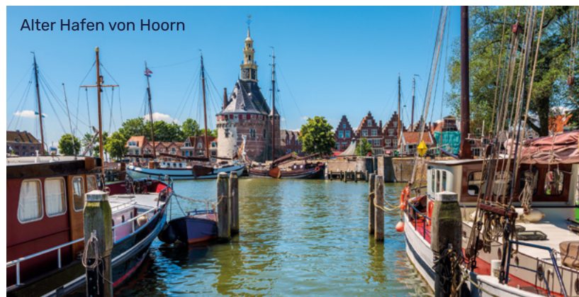
Alter Hafen von Hoorn

Alle Zeiten sind Richtzeiten. Programmänderungen, auch durch Hoch- oder Niedrigwasser, oder Verzögerungen bei Schleusendurchfahrten sind vorbehalten.