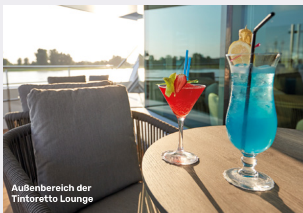
Außenbereich der Tintoretto Lounge