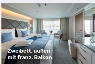
Zweibett, außen mit franz. Balkon