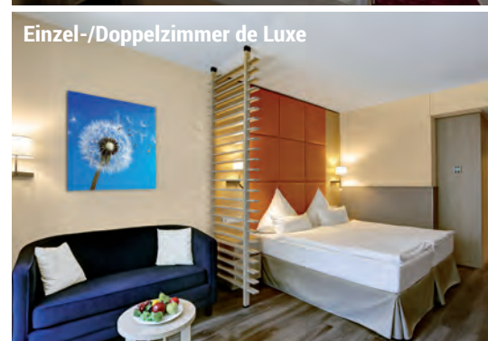
Einzel-/Doppelzimmer de Luxe