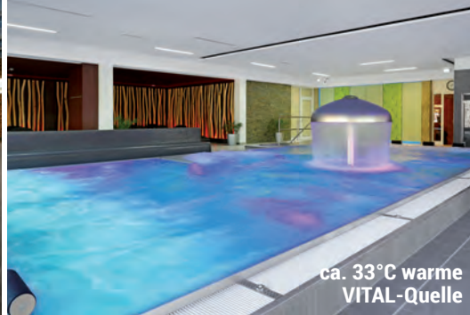
ca. 33°C warme VITAL-Quelle