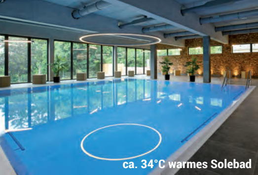
ca. 34°C warmes Solebad