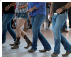
VITAL & AKTIV – fit bleiben