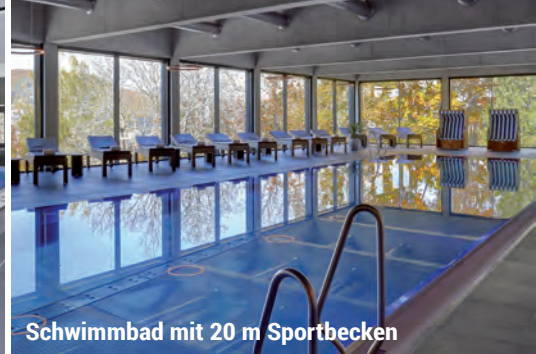
Schwimmbad mit 20 m Sportbecken