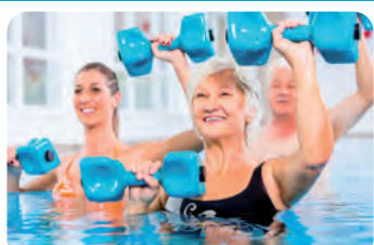
mit AQUA KINETIK, RÜCKENGYMNASTIK u. v. m.

Durch den Einsatz verschiedener Hilfsmittel (z. B. Hanteln) werden unterschiedliche Muskeln schonend trainiert.