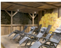
SALZLUFT – Atemwege immunisieren