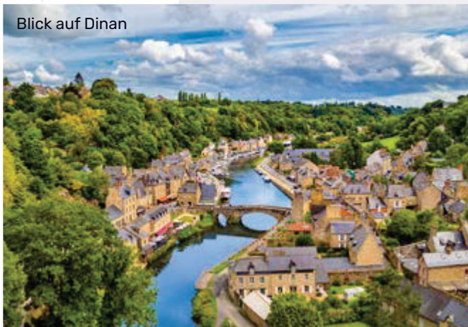
Blick auf Dinan

Zwischen dem europäischen Festland und Großbritannien gibt es viel zu entdecken: Die Isle of White begeistert Sie mit nostalgischem Charme, während Sie Cornwall, die Scilly Inseln und Guernsey mit üppigen Gärten im schönsten Sommerkleid begrüßen. Blicken Sie auf Jersey von der Burg Mont Orgueil über den himmelblauen Ärmelkanal und auf Alderney über raue Buchten, bei denen sich bizarre Klippen, sanfte Dünen und flache Strände gekonnt abwechseln. In Frankreich besuchen Sie den legendären Mont Saint Michel oder das mittelalterliche Dinan, in Belgien fahren Sie durch die stillen Kanäle von Gent oder Brügge. Nach einem Tag auf See gehen Sie schließlich gut erholt in Hamburg wieder an Land.