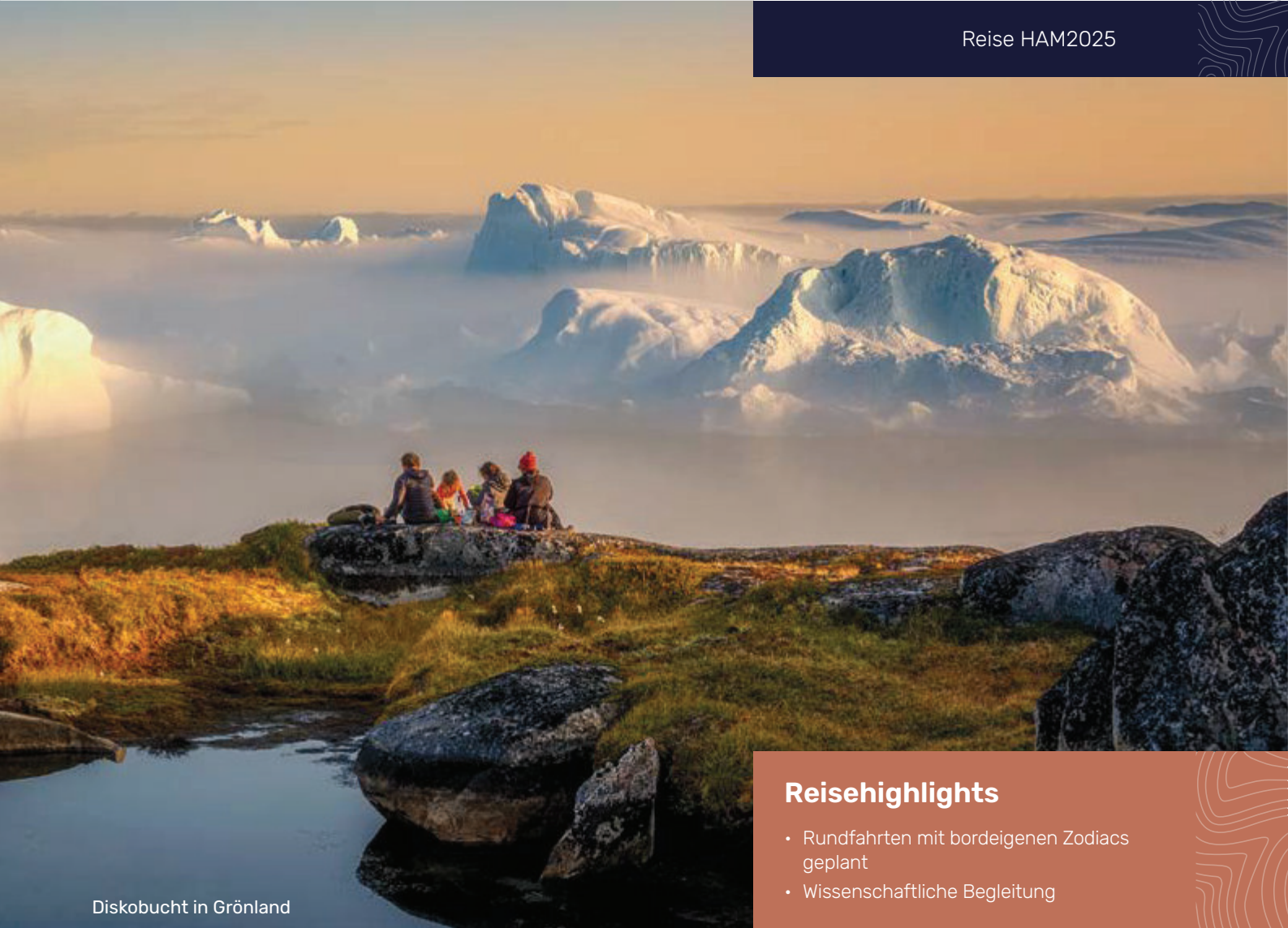
Diskobucht in Grönland