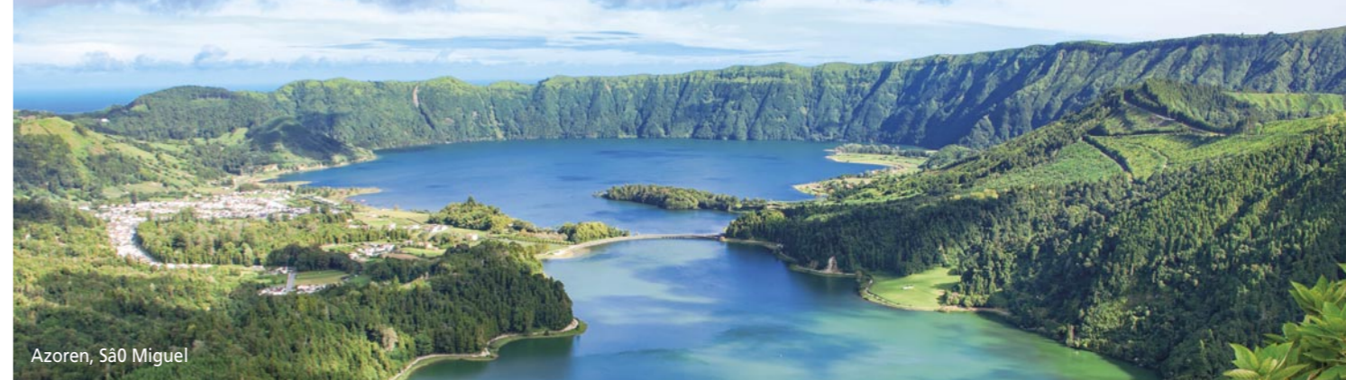
Azoren, São Miguel