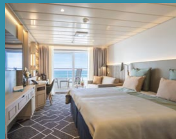
2-Bett-Junior-Suite, Balkon, Jupiter-/Lido-Deck (Kat. S, T)