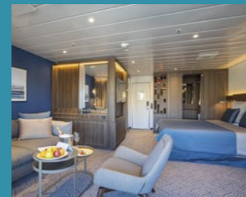
2-Bett-Suite, Balkon, Lido-Deck (Kat. V)