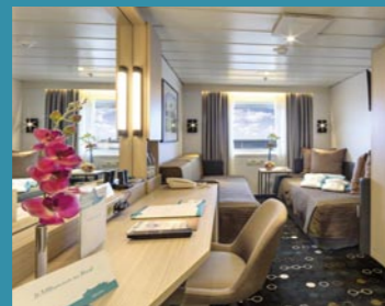
2-Bett außen, Neptun-/Saturn-/Orion-/Apollo-Deck (Kat. I, J, K, M, O, J1, L)