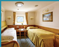
2-Bett außen, Steuermann-/Kapitans-Deck (Kat. K, M)