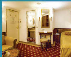
3-Bett innen, Steuermann-Deck (Kat. B)