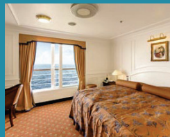
2-Bett-Junior-Suite, außen, franz. Balkon, Admirals-Deck (Kat. S)