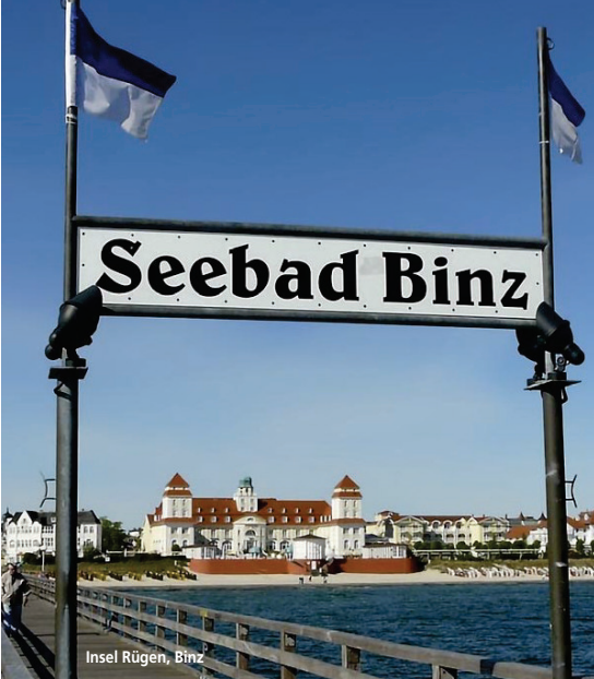
Insel Rügen, Binz