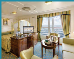
2-Bett-Suite außen, franz. Balkon, Admirals-Deck (Kat. T)