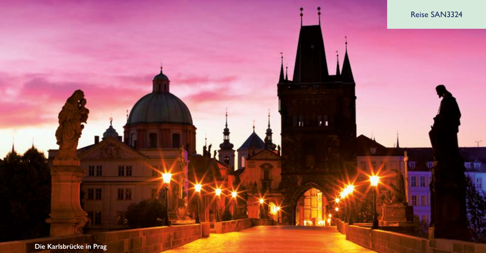
Die Karlsbrücke in Prag