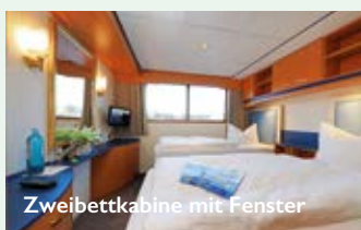
Zweibettkabine mit Fenster