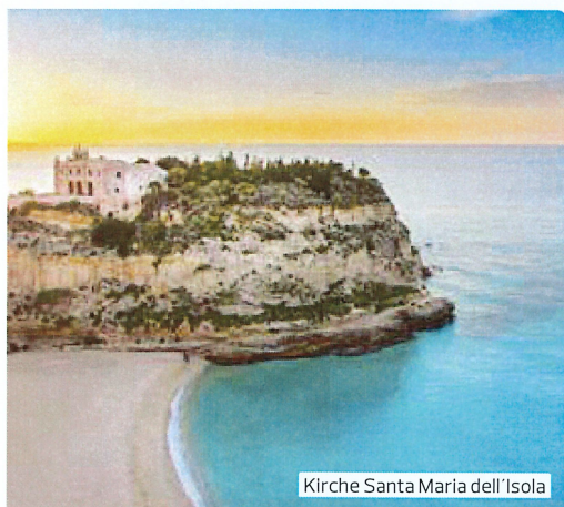
Kirche Santa Maria dell'Isola

Kalabrien liegt an der Spitze des Stiefels am südlichsten Punkt Italiens. Das angenehme Klima, die wunderschönen Farben des Meerwassers, die von Sandstränden unterbrochenen felsigen Küsten, die geheimnisvolle Landschaft, der unverfälschte Geschmack der heimischen Küche und antike Zeugnisse machen Kalabrien zu einem einzigartigen Landstrich!