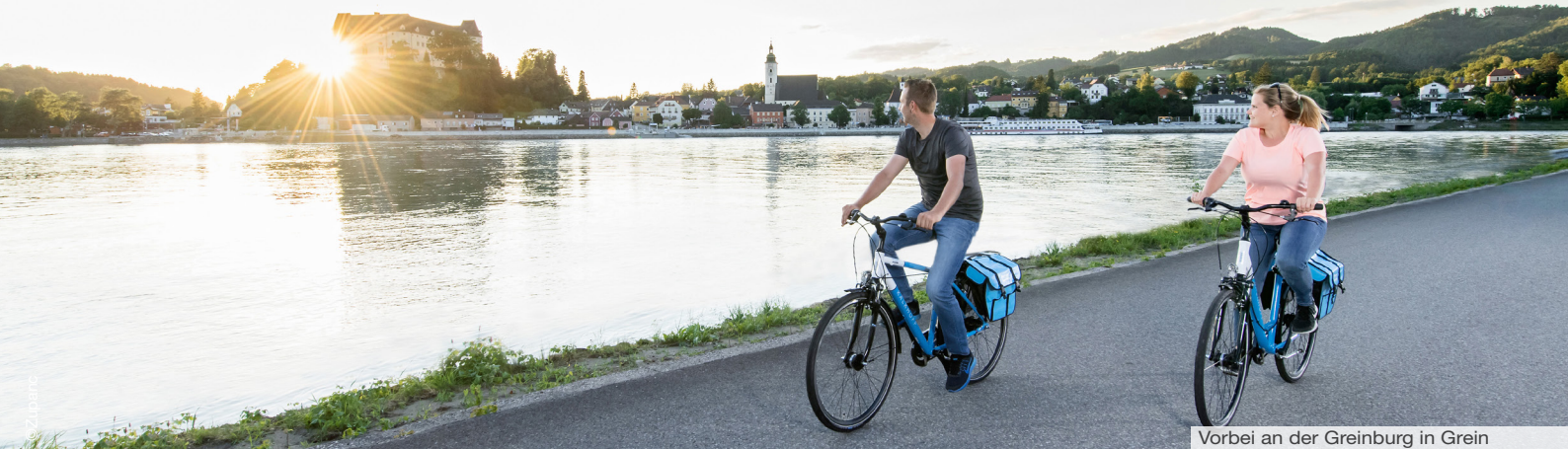
Vorbei an der Greinburg in Grein