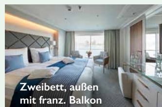
Zweibett, außen mit franz. Balkon