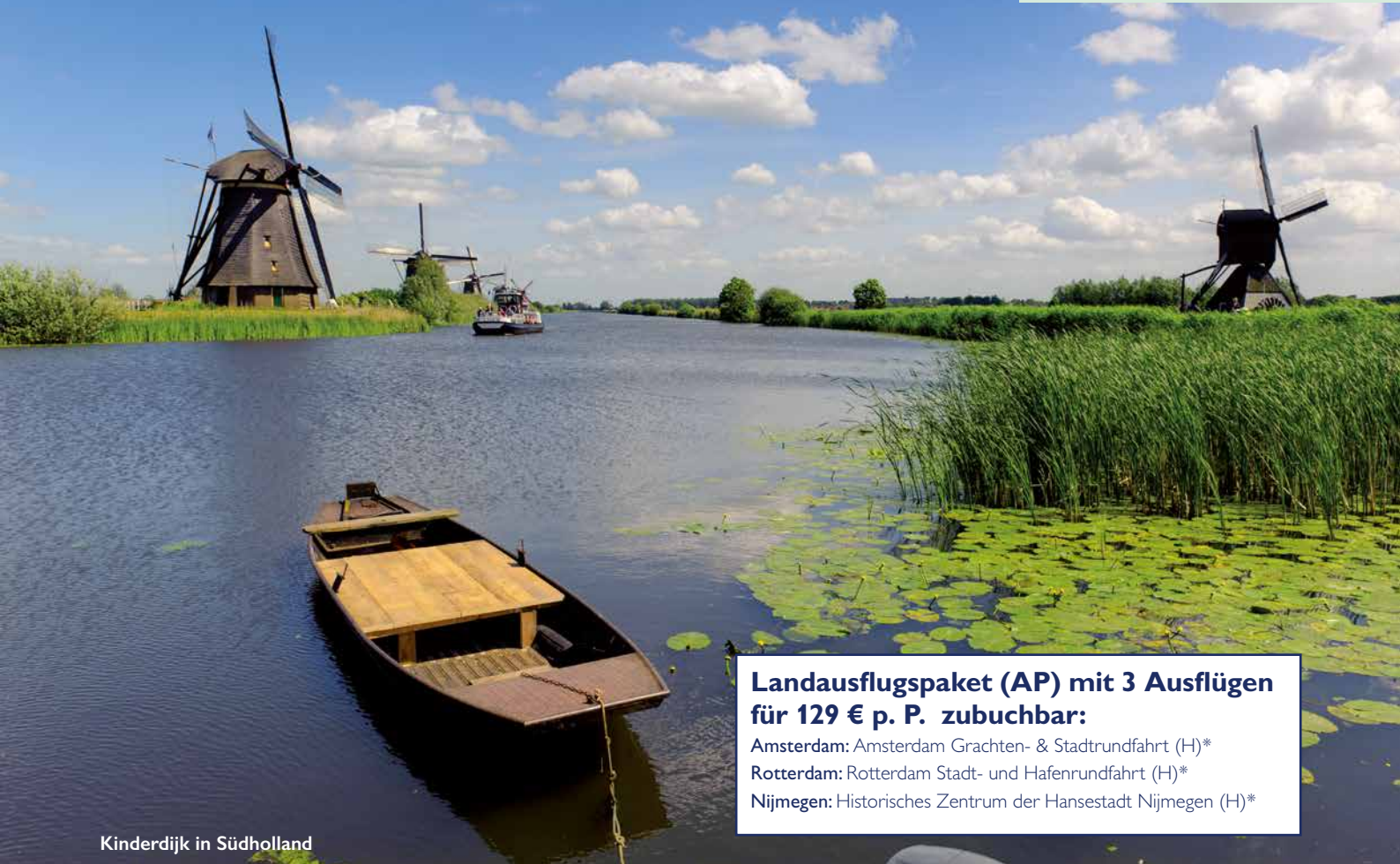
Kinderdijk in Südholland