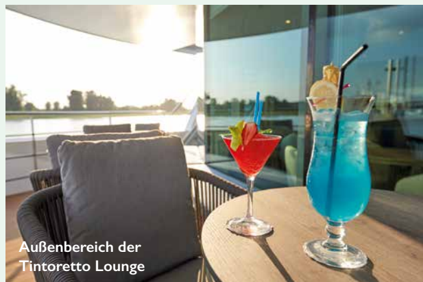
Außenbereich der Tintoretto Lounge