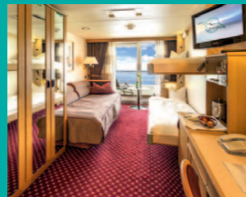
2-Bett-Junior-Suite, Balkon, Panorama-Deck (Kat. T)