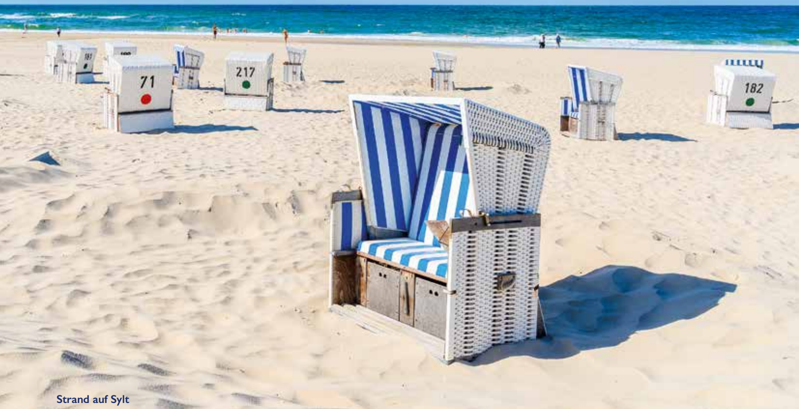
Strand auf Sylt