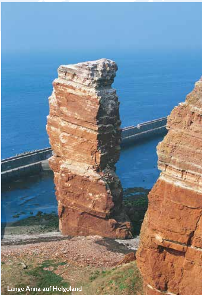
Lange Anna auf Helgoland

Zusätzlich buchbar*: Bustransfer von Koblenz nach Hamburg und zurück von Kiel € 160,- p.P. Für Abonnenten inklusive!