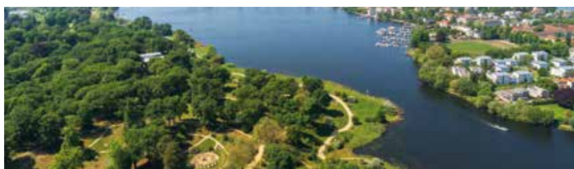
Blick von oben auf Potsdam

Auf den Spuren alter Zeiten erkunden Sie neugierig das Havelland: Durch das weiße Barockschloss Oranienburg flaniert, schreiten Sie stolzen Schrittes zum Brandenburger Dom auf der herbstbunten Dominsel, wo ein ganzes Adelsgeschlecht seine letzte Ruhe fand. Nachdem Sie in Rathenow mit der Statue des Kurfürsten Friedrich Wilhelm das größte barocke Sandsteindenkmal Norddeutschlands bewundert haben, steigen Sie in Potsdam die Freitreppe zum Schloss Sanssouci hinauf oder spazieren durch das Museum Barberini, das Sie in einem rekonstruierten klassizistisch-barocken Palast erwartet. Bei so viel Pracht fühlt man sich selbst schon ein bisschen wie von Adel.