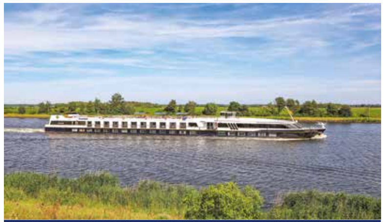
MS SANS SOUCI

Trinkgelder, Landausflüge, zusätzliche Veranstaltungen und private Ausgaben sind nicht im Reisepreis eingeschlossen.