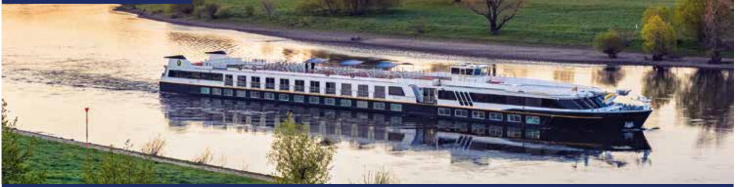
MS SANS SOUCI 🌟🌟🌟 – Unser Boutique-Schiff

NEUE ROUTE: SAISONFINALE MIT BRANDENBURG UND POTSDAM