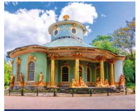
Chinesisches Teehaus im Park Sanssouci