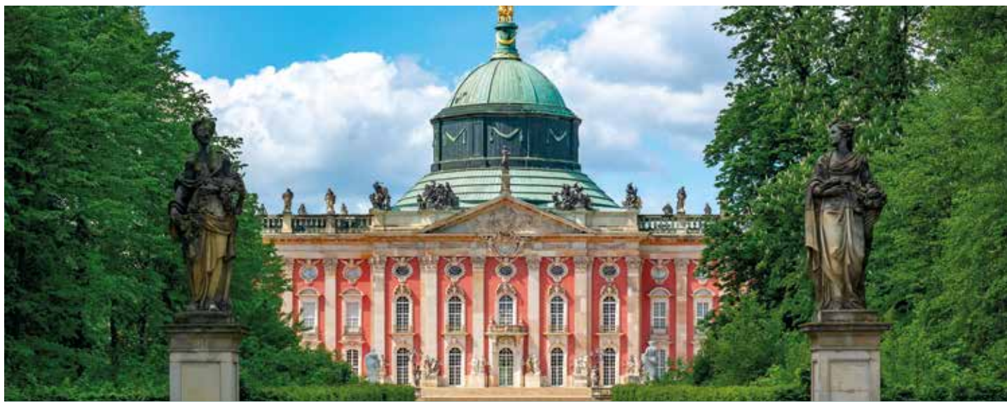
Neues Palais im Park Sanssouci