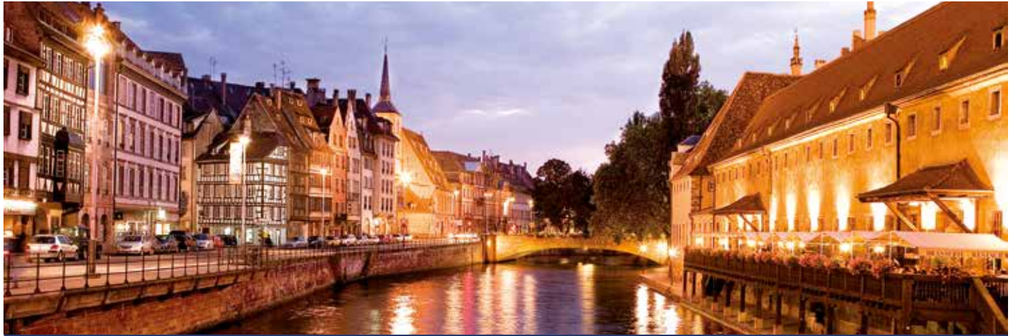
Abendstimmung im französischen Straßburg

6 Tage Flusskreuzfahrt vom 26.10. bis 31.10.2021