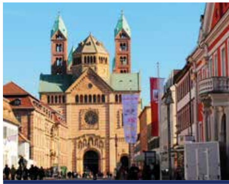
Speyer in der Herbstsonne