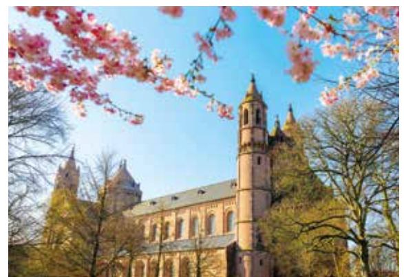
Kathedrale in Worms