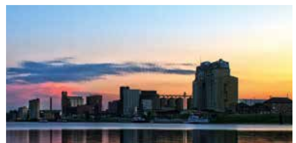
Sonnenuntergang im Mannheimer Hafen