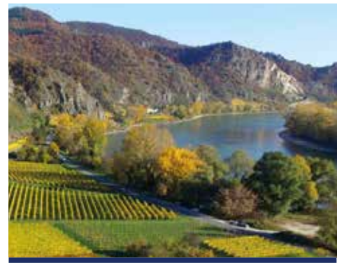
Blick auf den herbstlichen Rhein