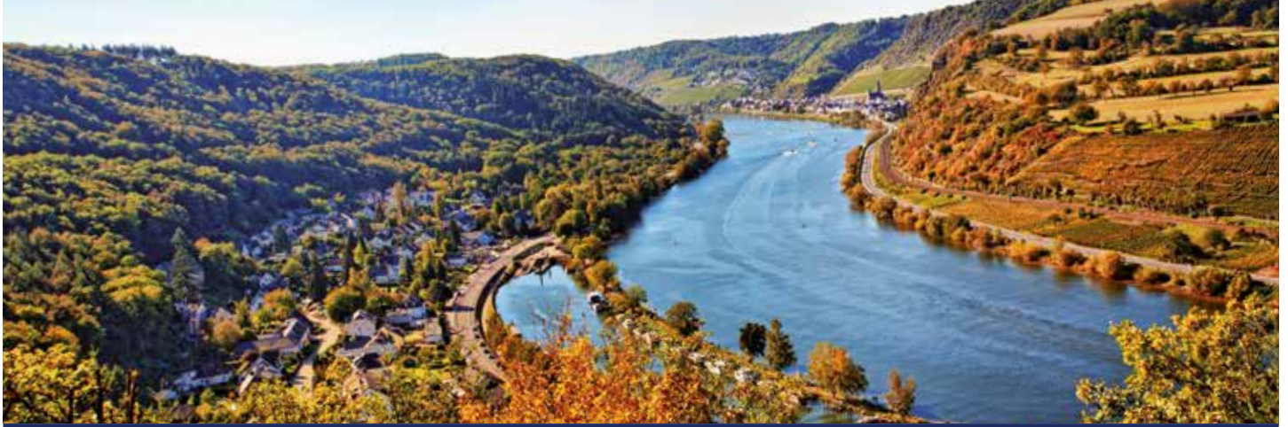
Cochem an der Mosel im Herbst

6 Tage Flusskreuzfahrt vom 21.10. bis 26.10.2021