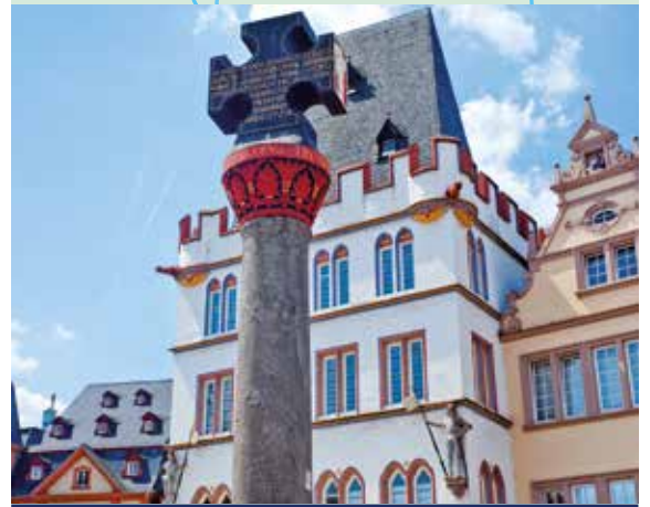
Marktplatz in Trier