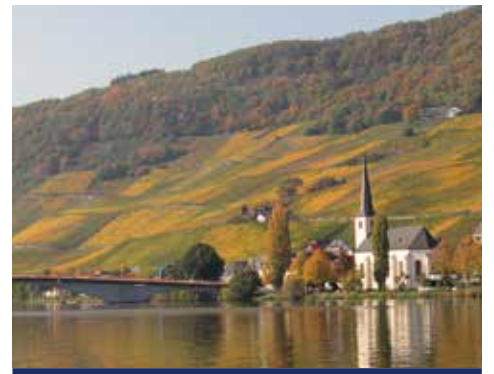
Entlang der Mosel