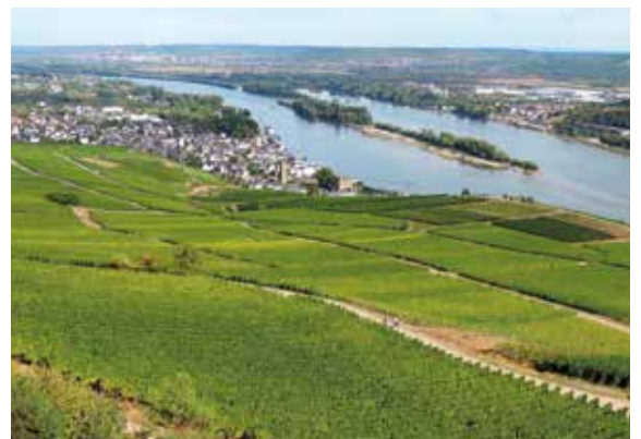
Rhein bei Rudesheim