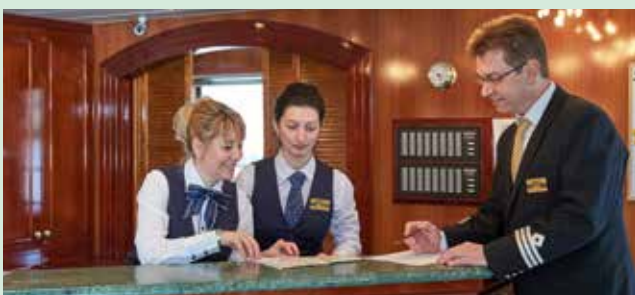
An der Rezeption