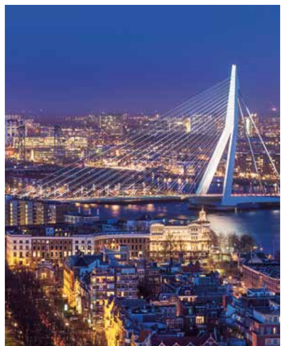
Blick über Rotterdam