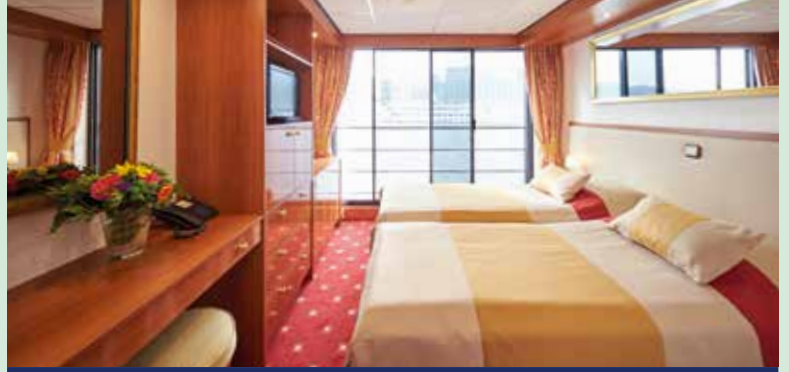
2-Bettkabine mit französischem Balkon