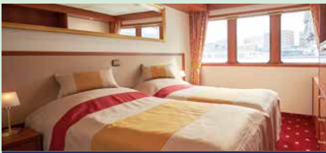
2-Bettkabine auf dem Hauptdeck