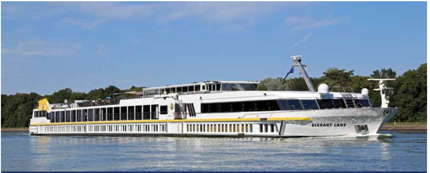
Reisen mit Stil und Komfort – MS ELEGANT LADY 🌟🌟🌟