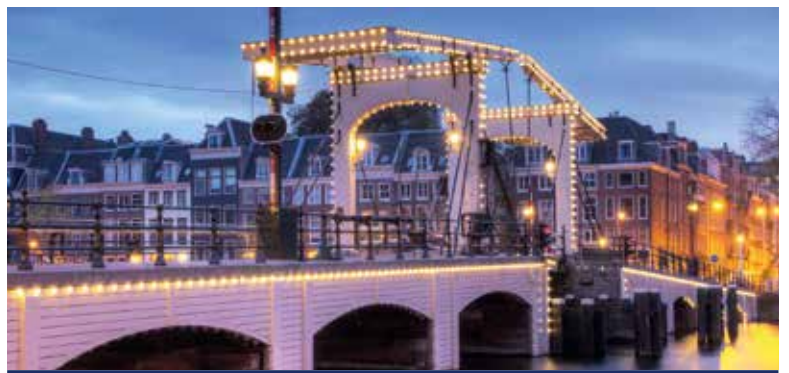
Winterliche Grachten in Amsterdam