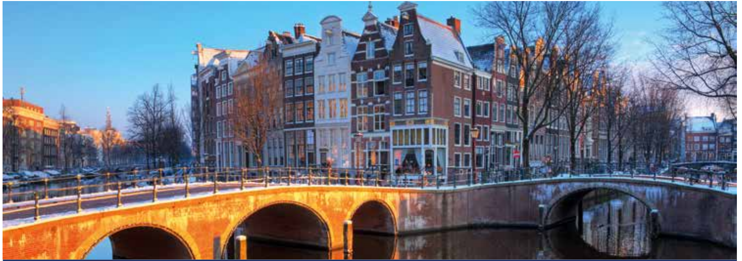
Amsterdam ist auch im Winter bezaubernd

7 Tage Flusskreuzfahrt vom 27.12.2021 bis 02.01.2022