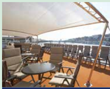
Sonnendeck mit Sonnensegel