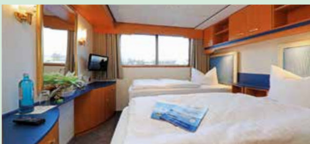
Zweibett-Kabine auf dem Eems-Deck