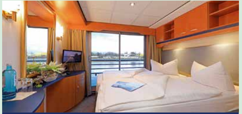
2-Bettkabine mit französischem Balkon