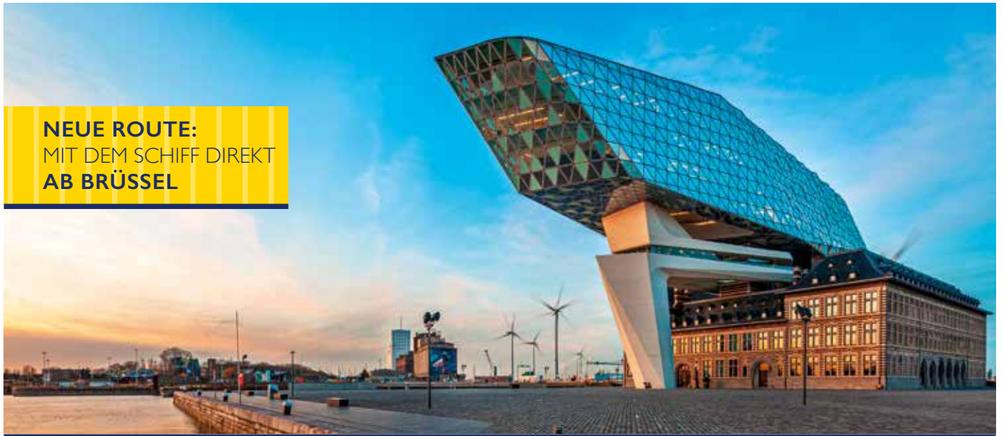
Hafenmeisterei in Antwerpen

NEUE ROUTE: MIT DEM SCHIFF DIREKT AB BRÜSSEL