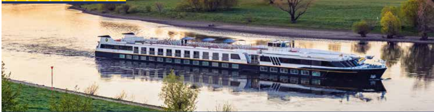
MS SANS SOUCI 🌿🌿🌿 – Unser Boutique-Schiff

NEUE ROUTE: MIT DEM SCHIFF DIREKT AB BRÜSSEL