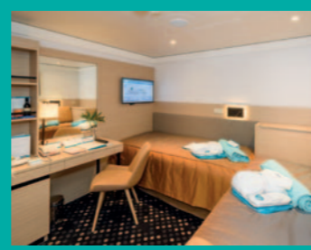
2-Bett, innen, diverse Decks (Kat. D, E, G)