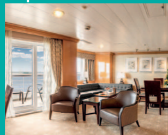
2-Bett, Royal-Suite, Balkon, Panorama-Deck (Kat. W)