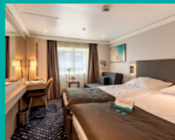
2-Bett, außen, diverse Decks (Kat. I, K, L, M, N, O)