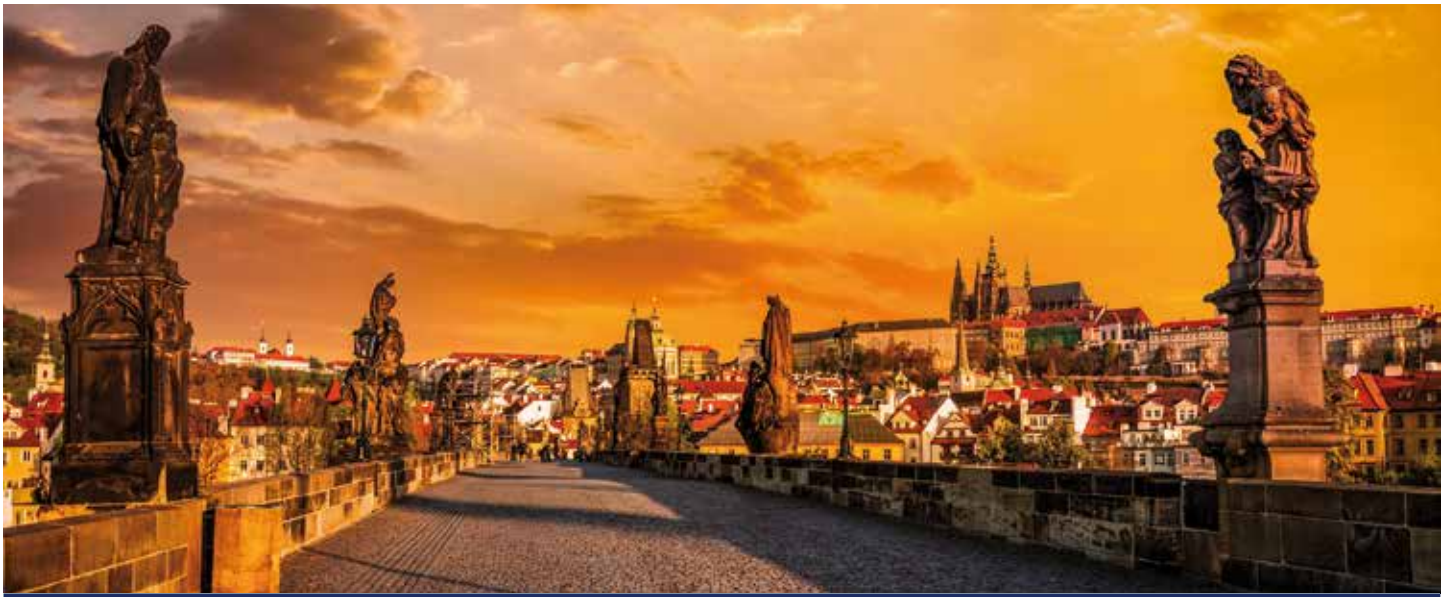
Karlsbrücke in Prag