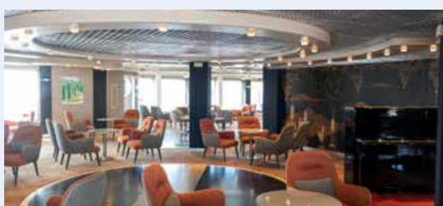
Die neue Weinstube