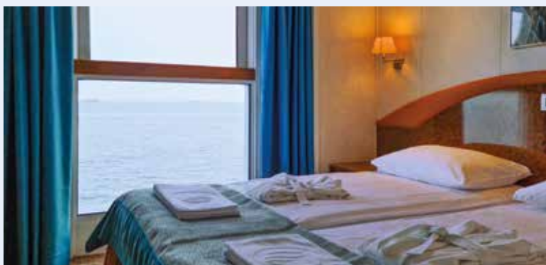
Kabine der Kategorie 10 mit Infinity-Fenster