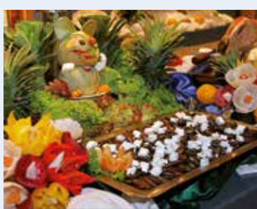
Leckerer vom Buffet