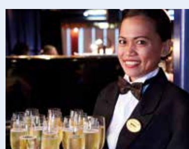
Willkommens-Sekt an Bord