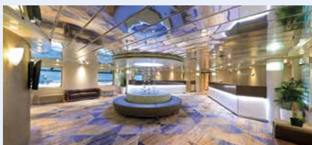
Der neugestaltete Rezeptionsbereich