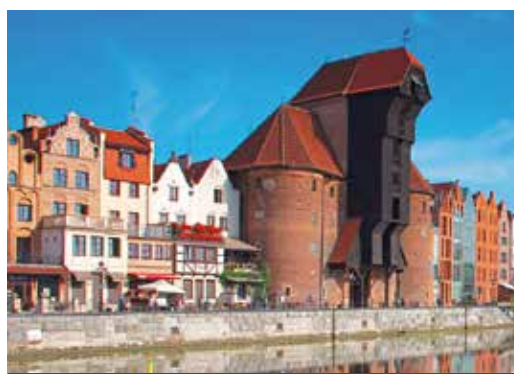
Das Krantor in Danzig