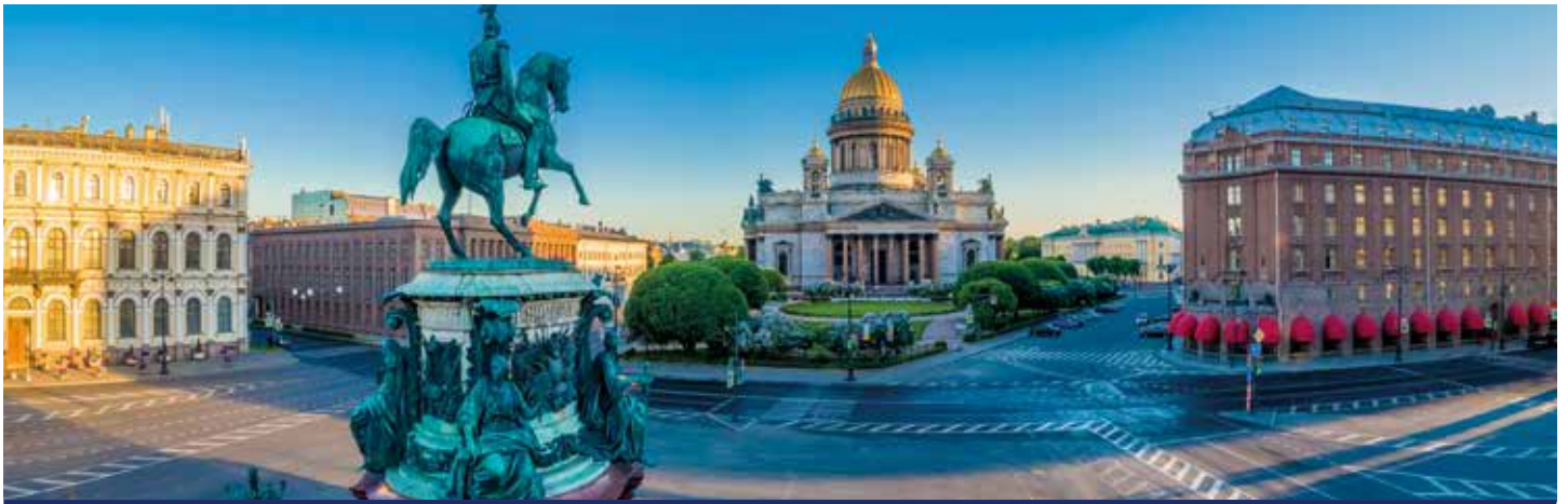
Die Isaakskathedrale ist die größte Kirche St. Petersburgs