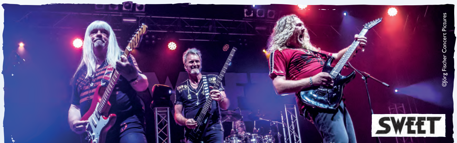
Für Sie an Bord: die Kultband SWEET