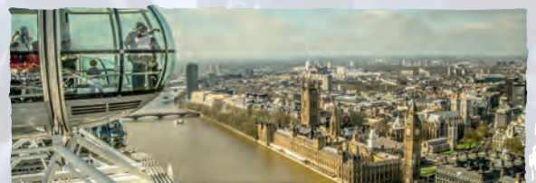
Toller Blick über die Stadt aus dem London Eye