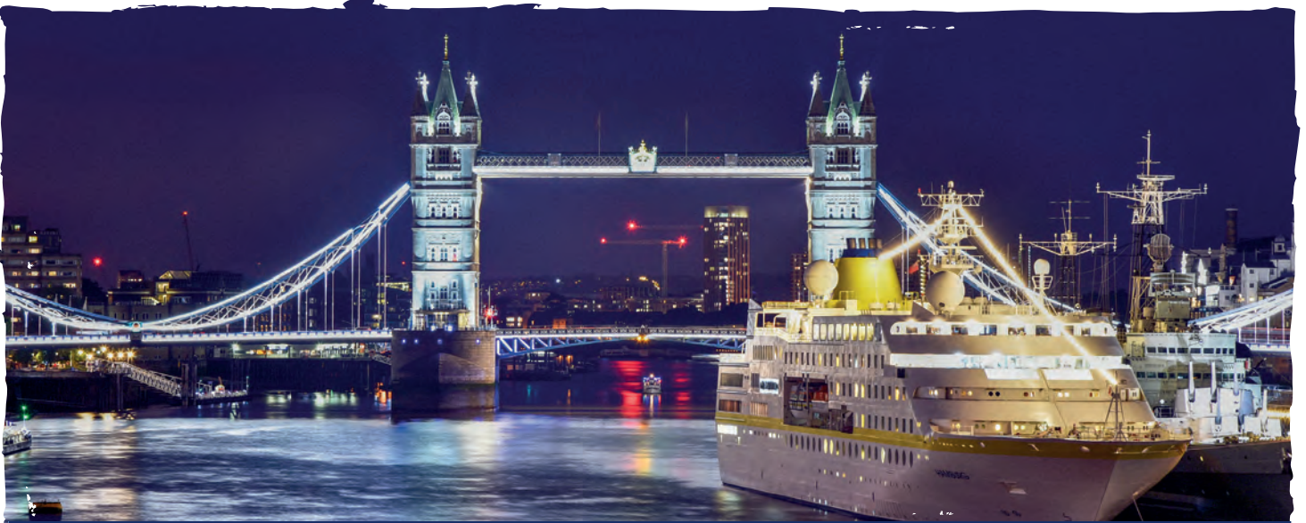
Traumhafter Liegeplatz im Herzen von London – MS HAMBURG 🌟🌟🌟