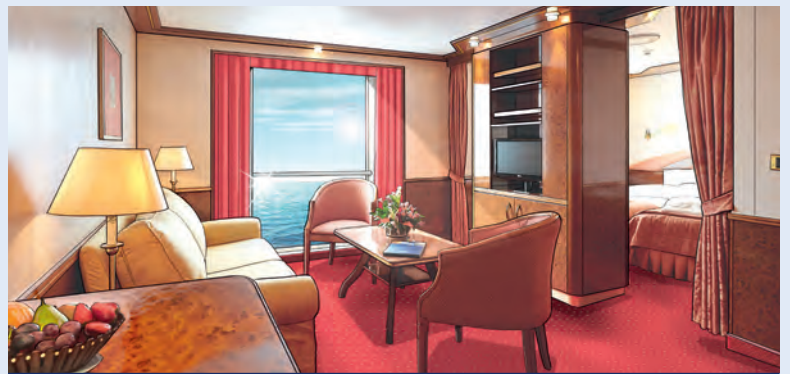
Modellbild einer Suite der Kategorie 12