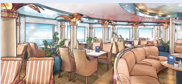
Der hellere und gemütliche Palmgarten (Modellbild)