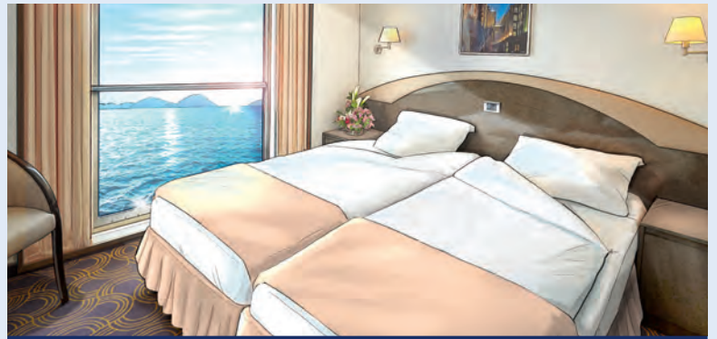
Modellbild einer Kabine der Kategorie 10