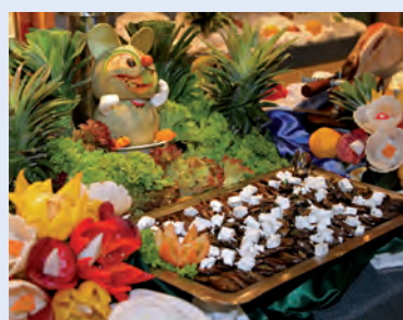
Leckerer vom Buffet