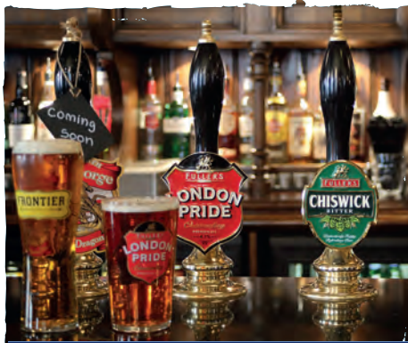
Traditionelle Pubs und flippige Nachtclubs