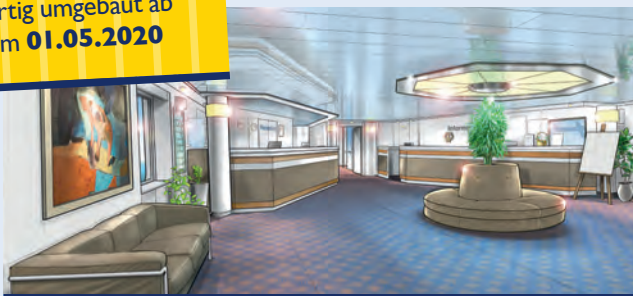
Der neugestaltete Rezeptionsbereich (Modellbild)