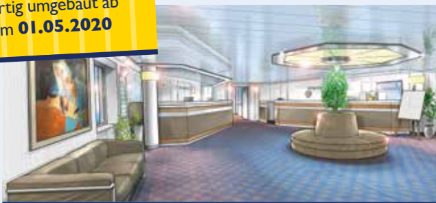
Der neugestaltete Rezeptionsbereich (Modellbild)