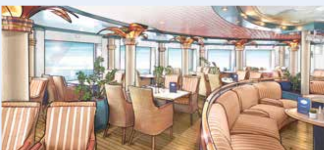
Der hellere und gemütliche Palmgarten (Modellbild)