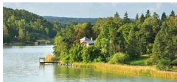
Die finnischen Åland Inseln

Auf der dänischen Mini-Insel Christiansø ein wenig Ruhe getankt, gehen Sie im nostalgischen Visby auf Entdeckertour. Voller Vorfreude auf das Baltikum blicken Sie über die Düna auf das Rigaer Panorama mit seinen drei herausragenden Türmen oder bewundern die eleganten Herrenhäuser von Tallinn. Da taucht auch schon St. Petersburg an der Mündung der Newa auf und verführt Sie mit Isaaskathedrale, Katharinenpalast, Eremitage und mehr. Mit einem Bummel durchs fröhlichsommerliche Stockholm und einem Besuch in der Hansestadt Wismar lassen Sie diese abwechslungsreiche Reise entspannt ausklingen. Genießen Sie die Passage des Nord-Ostsee-Kanals bevor diese abwechslungsreiche Reise in Hamburg endet.