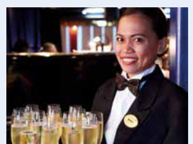
Willkommens-Sekt an Bord