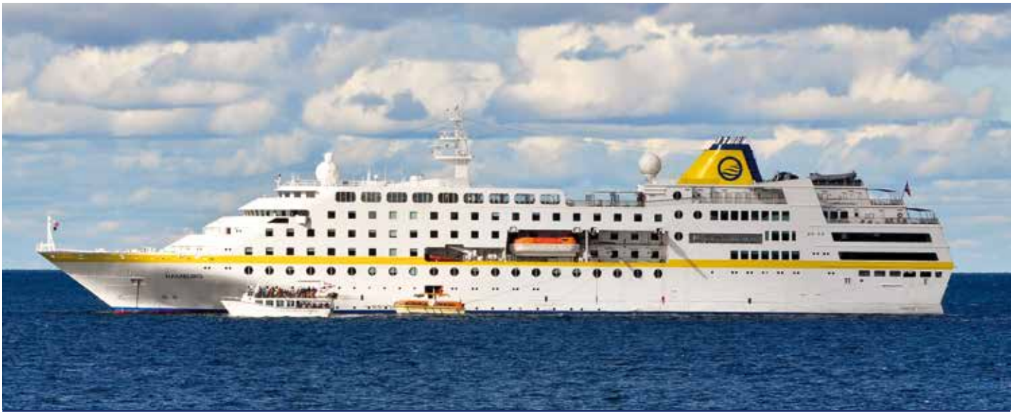
MS HAMBURG 🇪🇺 🇪🇺 🇪🇺