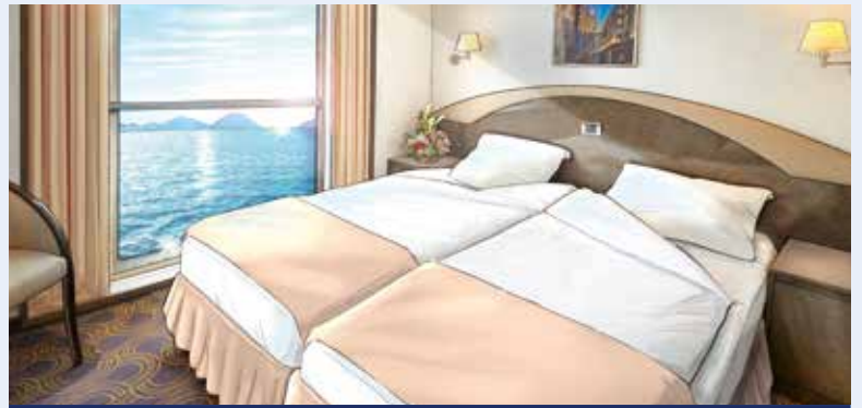
Modellbild einer Kabine der Kategorie 10