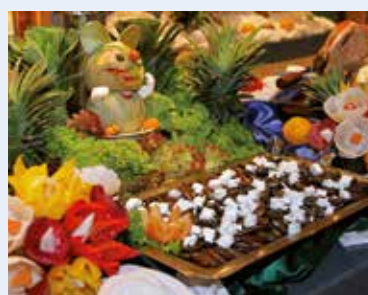
Leckerer vom Buffet