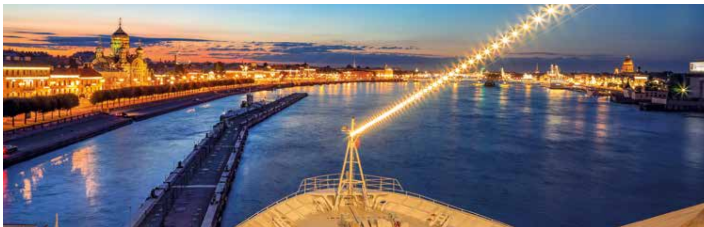
MS HAMBURG liegt im Herzen von St. Petersburg