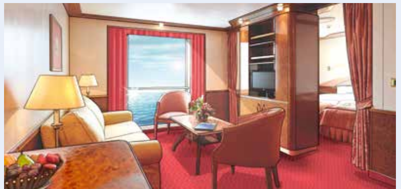
Modellbild einer Suite der Kategorie 12