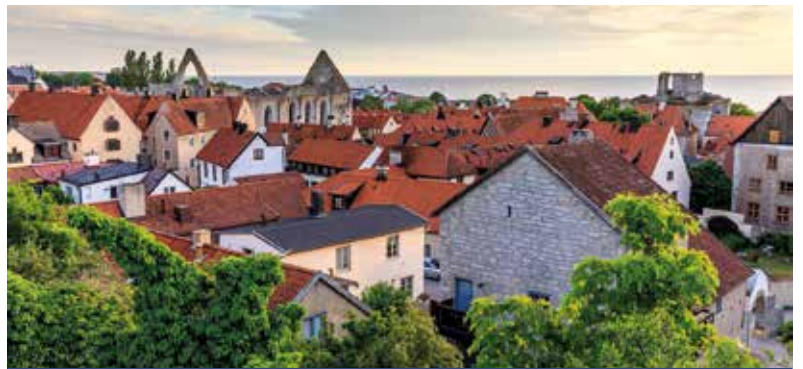
Blick über Visby