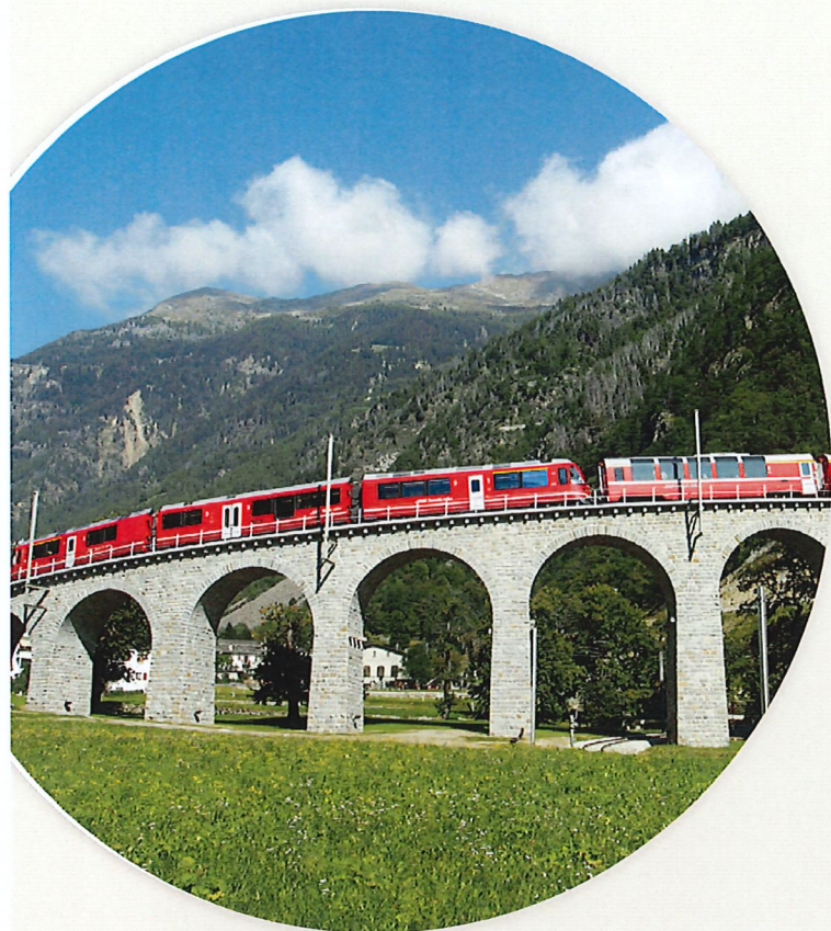
Das Kreisviadukt von Brusio im Schweizer Kanton Graubünden ist das Wahrzeichen der Berninalinie.

Graubündner Hauptstadt Chur. Der Bus bringt Sie zum 3- bis 4-Sterne-Hotel in Davos oder dem Nachbardorf Klosters. Im Anschluss an die Zimmerbelegung wird das Abendessen serviert.