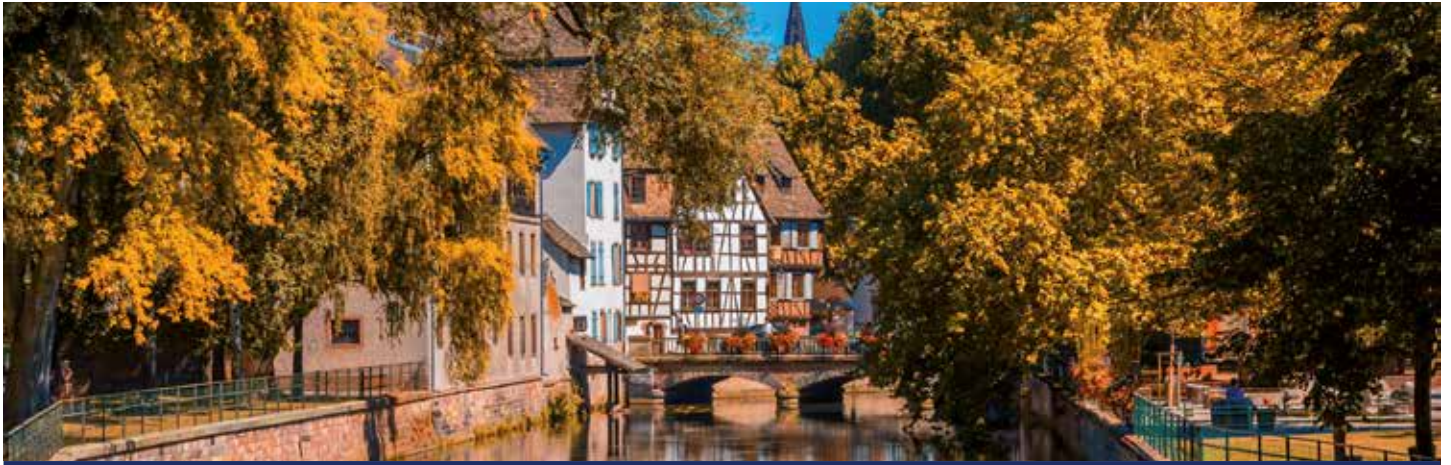
Straßburgs Stadtteil La Petite France ist bekannt für seinen malerischen Fachwerkhäusern und kleinen Gassen

6 Tage vom 19.10. bis 24.10.2020 oder 6 Tage vom 24.10. bis 29.10.2020