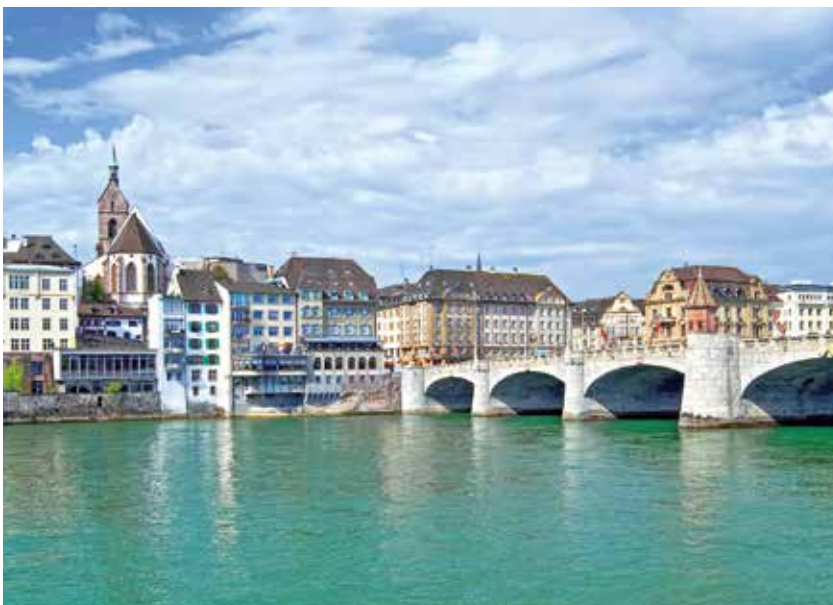
Blick auf die Altstadt von Basel

In ein buntes Herbstkleid gehüllt, kann Ihnen der Rhein so manche Geschichte erzählen. Kurz hinter Koblenz zieht Sie nicht nur die märchenhafte Loreley in ihren Bann, sondern auch das herbstliche Mittelrheintal, in das sich zahlreiche sagenumwobene Burgen und Schlösser schmiegen. In Mannheim entdecken Sie eines der größten Barockschlösser Europas, in Speyer die größte romanische Kirche der Welt und in Straßburg das atemberaubende Liebfrauenmünster, das zu den imposantesten Sandsteingebäuden der Erde zählt. Mindestens ebenso geheimnisvoll winkt Ihnen das Basler Münster am Rheinufer zu. Wer bekommt da nicht große Lust, auch noch dem versunkenen Nibelungenschatz in Worms nachzuspüren?