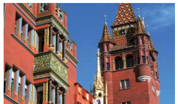
Historische Stadthalle von Basel