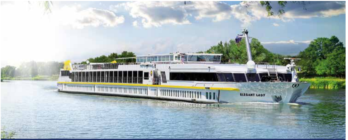
Reisen mit Stil und Komfort – MS ELEGANT LADY 🌞🌞🌞🌞