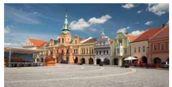
Marktplatz von Melnik

Alle Zeiten sind Richtzeiten. Programmänderungen, auch durch Hoch- und Niedrigwasser, oder Verzögerungen bei Schleusendurchfahrten sind vorbehalten. Liegeplatzzuweisung in Dresden erfolgt nach Schiffsaufkommen. HT = Halbtagesausflug A = Abendausflug