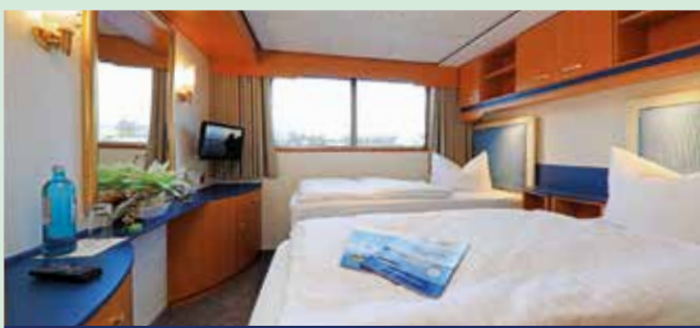
Zweibett-Kabine auf dem Eems-Deck