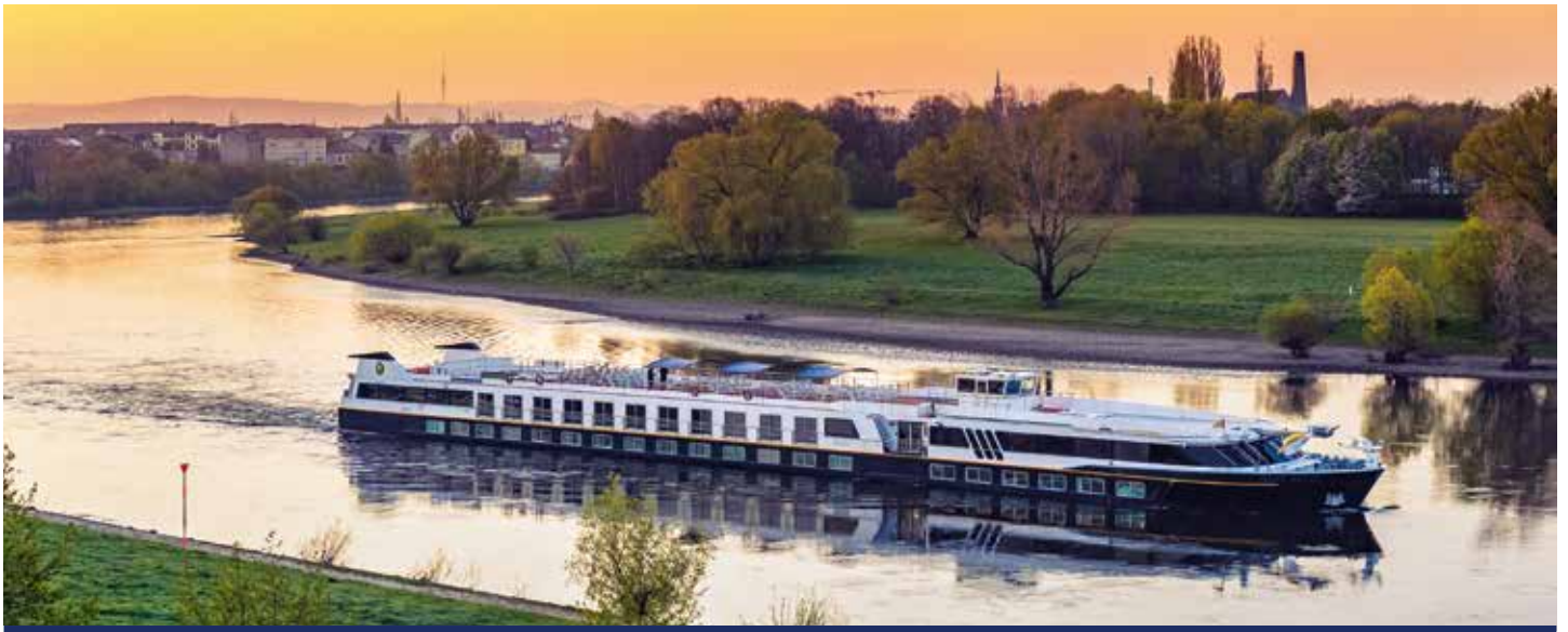
MS SANS SOUCI 🌟🌟🌟 – Unser Boutique-Schiff