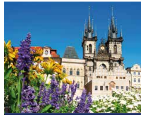
Teynkirche in Prag