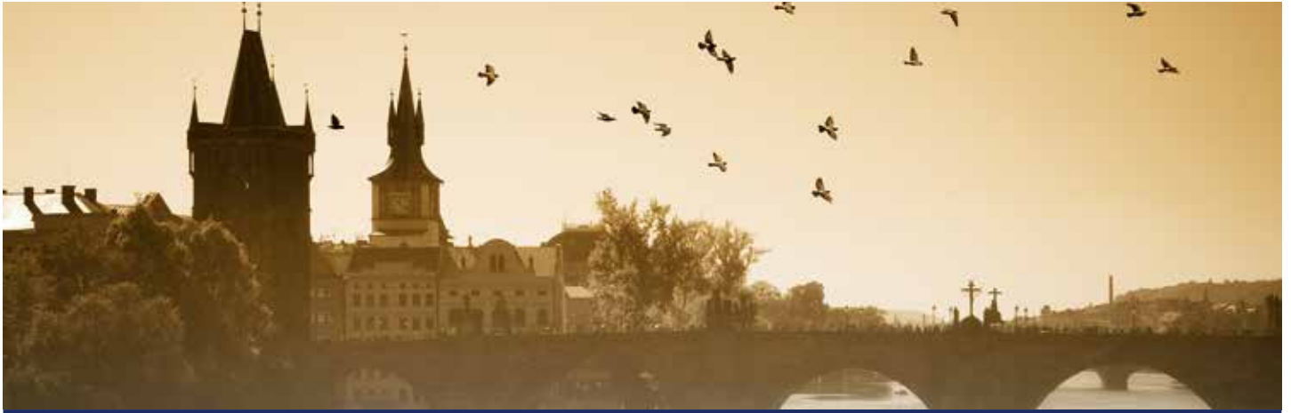
Karlsbrücke in Prag