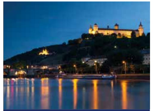
Toller Blick auf das nächtliche Würzburg