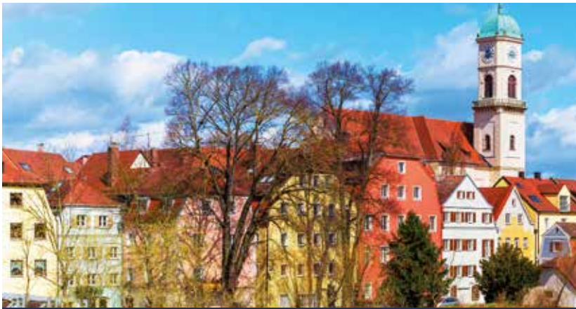
UNESCO-Welterbestadt – die Regensburger Altstadt ist die einzige erhaltene mittelalterliche Großstadt Deutschlands