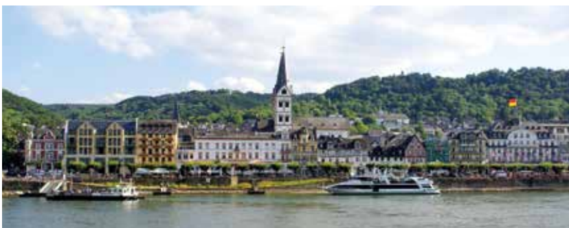
Boppard am Rhein

Der Herbst ist genau die richtige Jahreszeit, um die Welt mit neuen Augen zu sehen. In Passau an Bord gekommen, flanieren Sie in Regensburg durchs historische Zentrum oder fahren zum Donaudurchbruch, wo die gigantischen Felswände bis zu 80 Meter hoch emporragen. Nachdem Sie in Nürnberg bis zur Kaiserburg spaziert sind, bestaunen Sie in Bamberg das nostalgische Rathaus oder blicken von der Festung Marienberg in Würzburg über herbstbunte Landschaften. In Eltville die Perle des Rheingau entdecken, in Boppard zur Ruine des Römerkastells bummeln oder in Koblenz die Moselmündung fotografieren? Kommen Sie einfach mit an Bord!