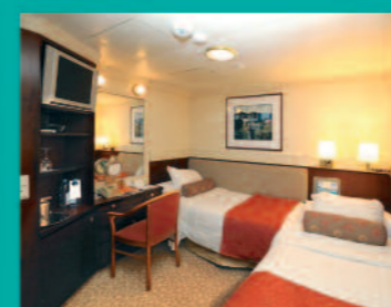
2-Bett, Superior PLUS, außen Balkon, Apollo-Deck (Kat. Q+)