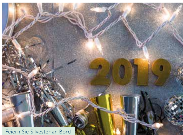
Feiern Sie Silvester an Bord

Das alte Jahr in Ruhe ausklingen lassen und das neue Jahr furios begrüßen? Steigen Sie ein und kommen Sie mit! Den Weihnachtsstress endlich hinter sich gelassen, fahren Sie entspannt durch die winterlichen Grachten von Amsterdam, bummeln durch das berühmte Rijksmuseum oder Madame Tussauds raffiniertes Wachsfigurenkabinett. Nachdem Sie in Rotterdam durch einen der größten Häfen der Welt geschippert sind, schlendern Sie im beschaulichen Willemstad durch den nostalgischen Stadtkern mit vielen gemütlichen Restaurants zwischen hübschen Gebäuden aus dem 17. und 18. Jahrhundert. Einmal um die eigene Achse gedreht, da stehen Sie auch schon andächtig vor dem riesigen Genter Flügelaltar in der St.-Bavo-Kathedrale oder erklimmen die vielen Stufen bis zur Aussichtsplattform des Brügger Belfrieds. Welch fantastische Aussicht!