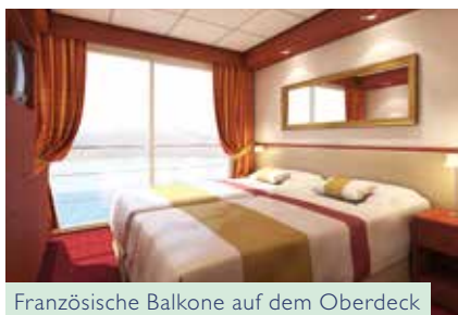
Französische Balkone auf dem Oberdeck